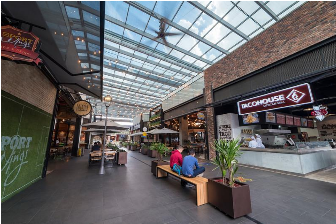
Zonas con ventilación natural