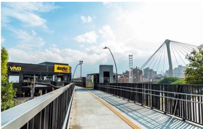
Zonas con ventilación natural