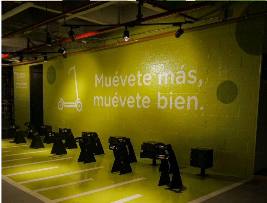
Parqueaderos para bicicletas y movilidad eléctrica